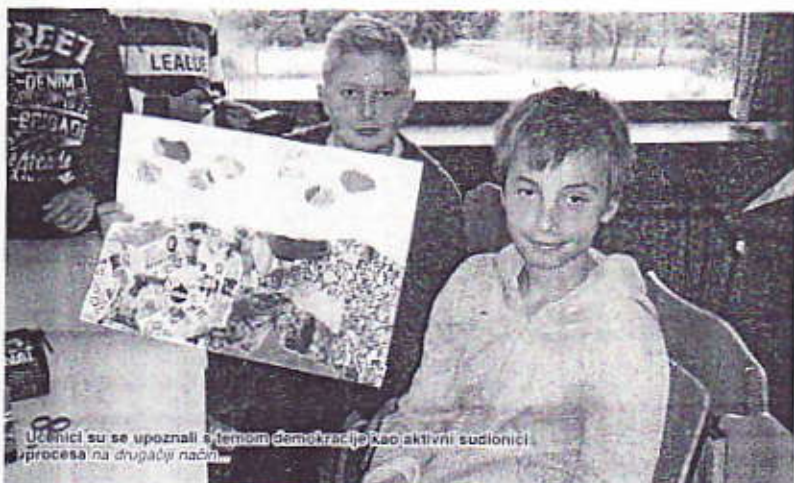
Učenici su se upoznali s temom demokracije kao aktivni sudionici procesa na drugačiji način

Pisu Sanja Minarik, dipl. učiteljica Ana Vukušić Mahin prof. hrv. jezika Materijale prikupile Ines Polanićak, dipl. učiteljica Neva Capin, prof. psihologije