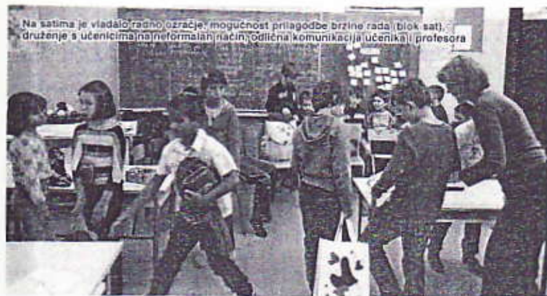
Na satima je vladalo radno ozračje, mogućnost prilagodbe brzine rada (blok sat), druženje s učenicima na neformalan način, odlična komunikacija učenika i profesora